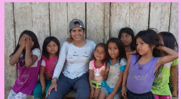
NIÑOS AWAJUN 2018