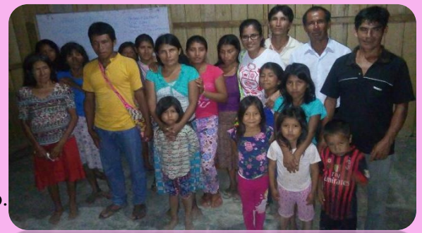
Iglesia Awajun 2016